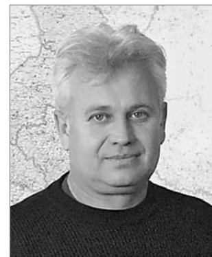
Директор ТОВ «Діапазон»

У непевні 90-ті рр. підприємство активно вело пошуки заробітку, що зумовило його реорганізацію у 1998 р. в НПО «Діапазон» та початок серійного виробництва машин та