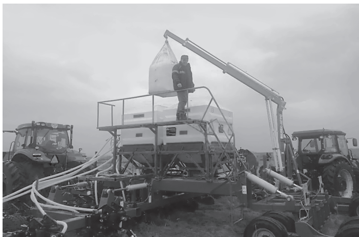
ГСТ-1000. Завантаження біг-бегу до посівного комплексу